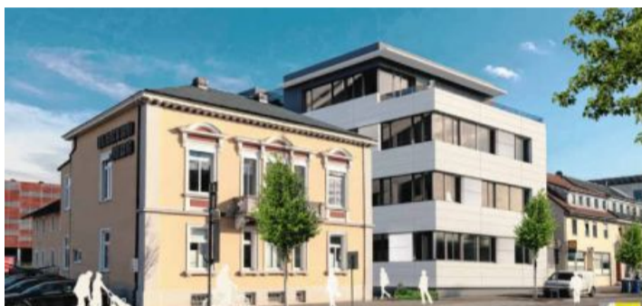
So soll das Gebäude aussehen.